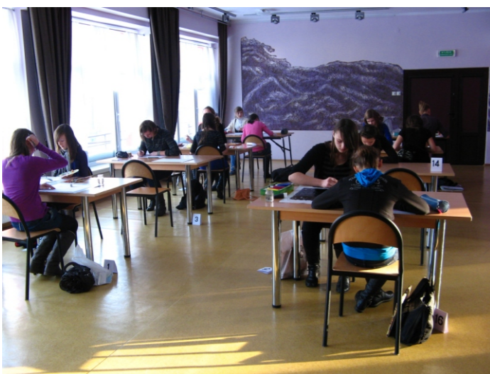
Konkurs "Stop dopalaczom" w ZSP w Rudnikach