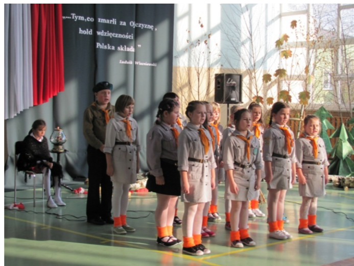
11 Listopada w naszej gminie