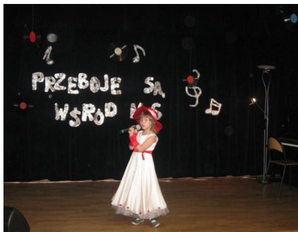
Konkurs "Przeboje są wśród nas"