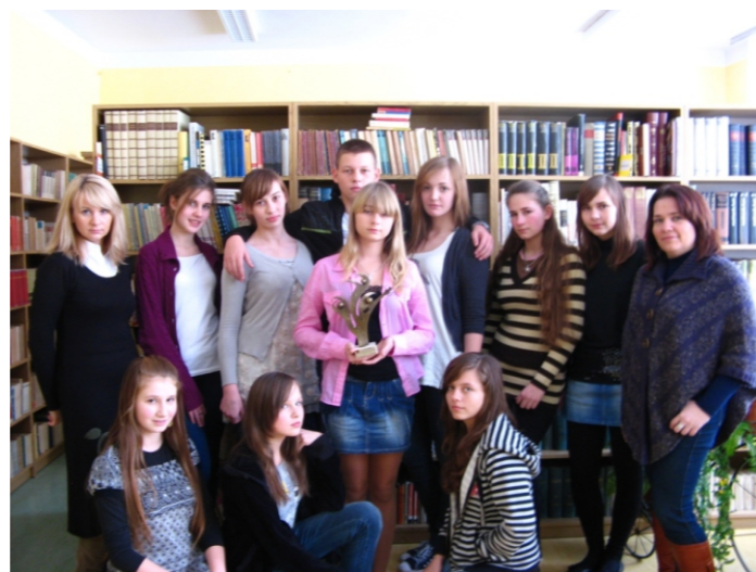
Uzdolniona teatralnie młodzież z Rudnik