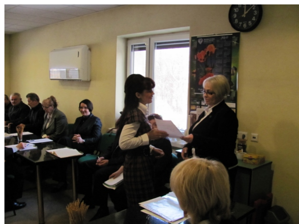
I sesja nowej Rady Gminy